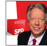
Ernst Dieter Rossmann